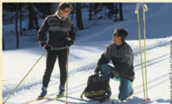
Agence Nauti@T Les Contamines

CHALET NORDIQUE : Tél. 04 50 47 10 00 – Fax : 04 50 47 07 65